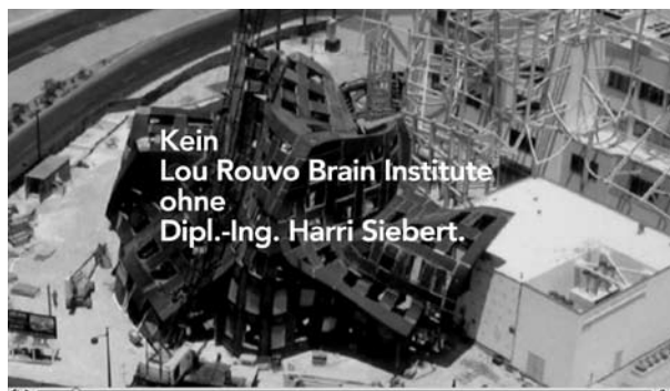
Die vier Videos der von einer Jury ausgewählten Projekte sind ab sofort unter anderem auf dem neuen YouTube-Channel der Kammer zu sehen.

Die vier neuen Videos sind ab sofort auf der Internetseite www.keinding-ohne-ing.de sowie auf YouTube ( www.youtube.com/user/ikbaunrw ) zu sehen. Geplant ist darüber hinaus, sie in der allgemeinen Öffentlichkeitsarbeit der Kammer einzusetzen, sie also beispielsweise auch bei Veranstaltungen zu präsentieren. Die Filme sollen dazu beitragen, im Rahmen der Kampagne ‚Kein Ding ohne ING.‘ noch