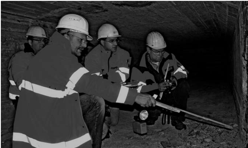
Das A und O für Brückenprüfer: Praxis-Erfahrung.