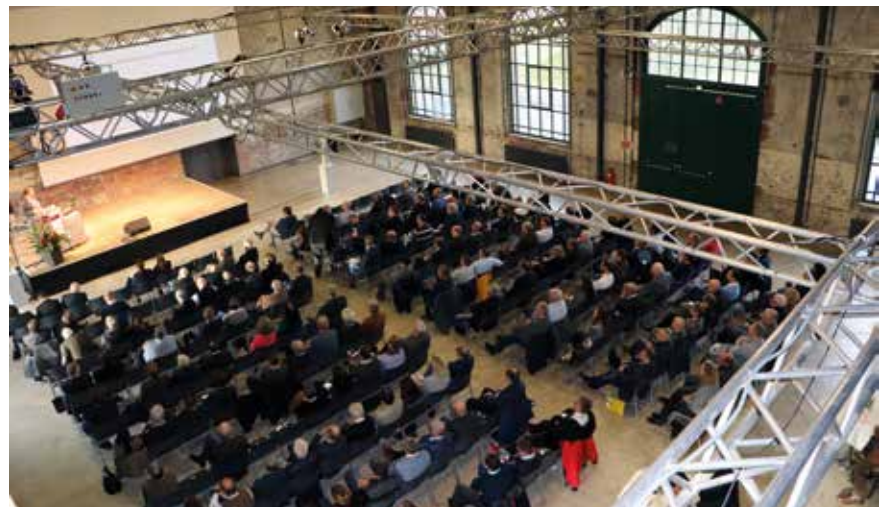
Fortsetzung: Seite 8