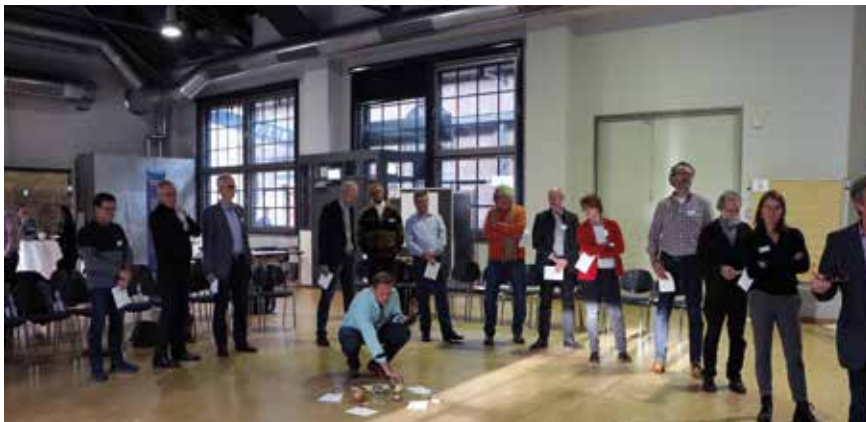
Wie lassen sich Familie und Beruf vereinbaren?