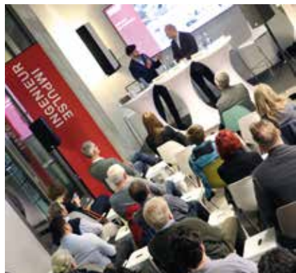
Die Gäste beteiligten sich engagiert an den Diskussionen.

Zum Abschluss des gelungenen Abends wurde intensiv genetzwerkt und viele Gäste nahmen trotz des Novemberwetters an einer Führung durch den Medienhafen teil.